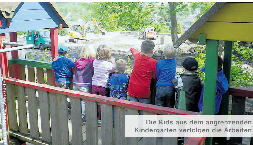
Die Kids aus dem angrenzenden Kindergarten verfolgen die Arbeiten

Die Wipper-News können Sie auch online lesen unter www.wipperfuerth.de