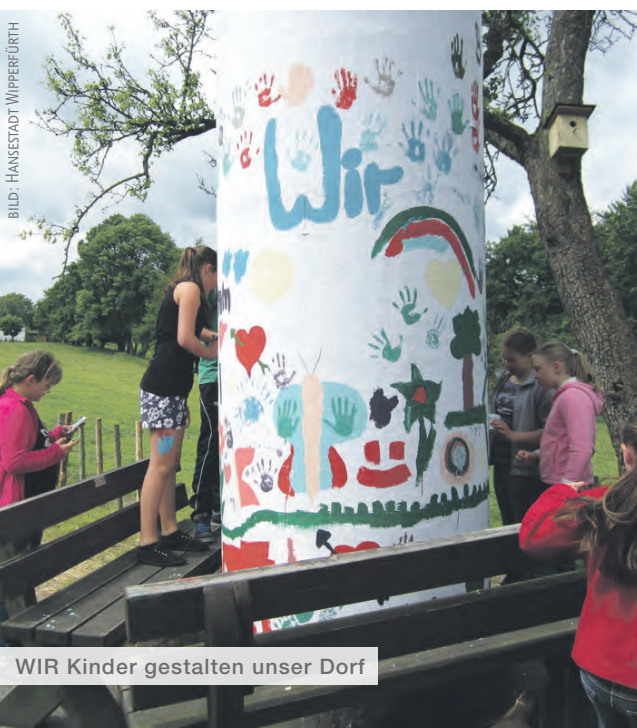
WIR Kinder gestalten unser Dorf

☎ 02267 / 64 -219 ✉ mery.kausemann@ wipperfuertth.de