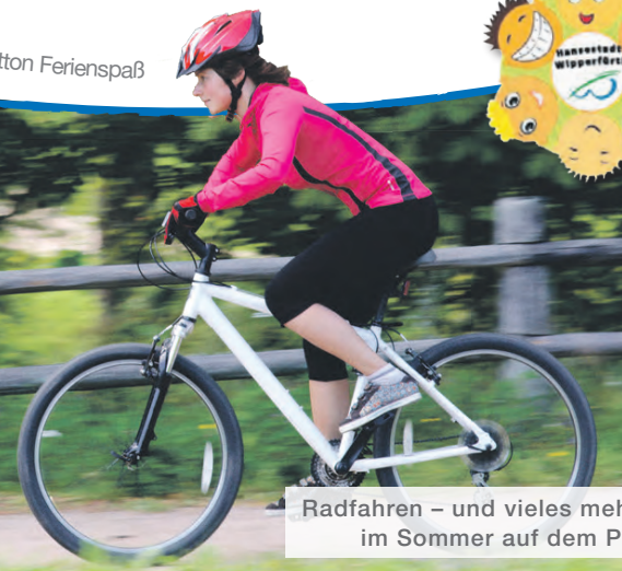
Radfahren – und vieles mehr – steht im Sommer auf dem Programm