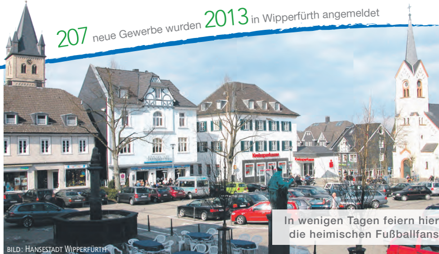
In wenigen Tagen feiern hier die heimischen Fußballfans

Wenn im Juni die WM in Brasilien startet, wird der Marktplatz zur großen Public-Viewing-Area