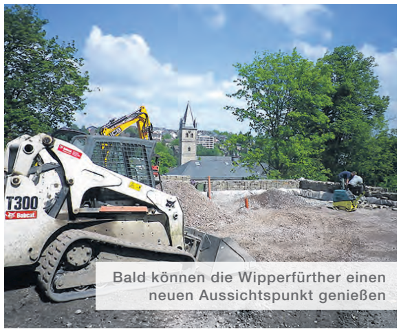
Bald können die Wipperfürther einen neuen Aussichtspunkt genießen