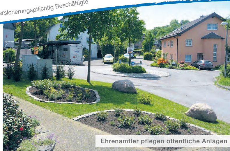
Ehrenamtler pflegen öffentliche Anlagen

Neues Angebot der Ökumenischen Hospiz-Initiative Wipperfürth